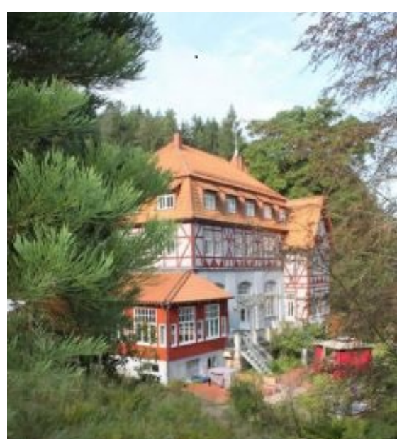
Waldschlösschen bei Reinhausen

(em) Die Auswertung der Evaluationsbögen (n = 31) des Fachtreffens im April 2017 im Waldschlösschen bei Göttingen hatte ergeben, dass die Teilnehmenden gut bis sehr zufrieden mit dem Fachtreffen waren (6-stufige Skala: AM = 1,4; Md = 2; Mo = 2).