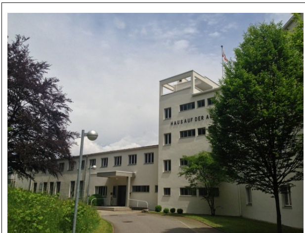
Haus auf der Alb: Bauhaus-Architektur mitten in der Natur

(js) Gar nicht mehr lange und unsere Jahrestagung startet. Schon seit Januar kann mensch sich anmelden; zunächst durften dies exklusiv unsere Mitglieder. Der Ansturm hat dann dazu geführt, dass in kurzer Zeit die Betten im Ta-