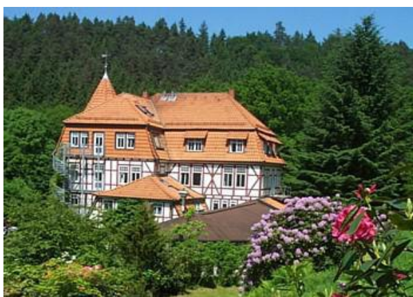
Tagungshaus Waldschlösschen bei Göttingen

(js) Schon Anfang April findet 2017 unser Jahrestreffen statt – traditionell der Höhepunkt des Verbandslebens. Traditionell wird bei den Tagungen die angenehme Atmosphäre geschätzt, die langjährigen Mitgliedern ein zwangloses Wiedersehen ermöglicht und neuen Mitgliedern den Einstieg ins Verbandsleben erleichtert. Inhaltlich hat sich der Vorstand für moderne Themen entschieden: mit LSBTIQ&Migration , Trans*Inklusion und Islamophobie sind unsere Workshops nah am Puls gesellschaftlicher Fragen und Herausforderungen. Dazu gibt es ein Novum, das keines sein sollte: zum ersten Mal seit Menschengedenken findet sich im Tagungsprogramm ein Workshop zur Bisexualität . Eigentlich unfassbar, dass das nicht schon vor 20 Jahren angeboten wurde. Höchste Zeit, diese Lücke zu schließen.