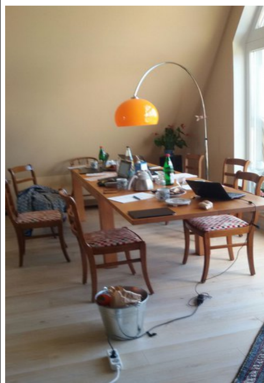
Pause bei der jüngsten Vorstandstagung in Hamburg. Zu sehen ist, dass es noch Platz für Mitmacher*innen gibt.