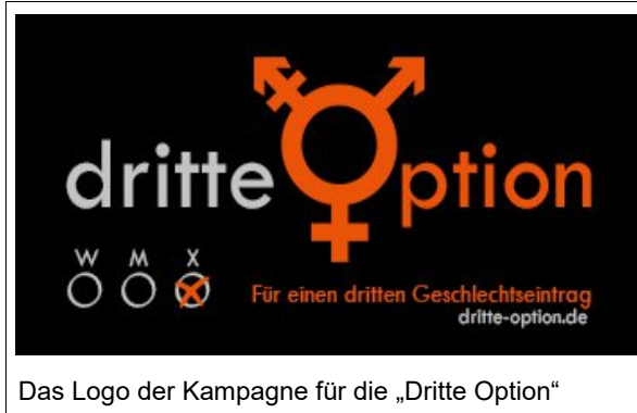
Das Logo der Kampagne für die „Dritte Option“

In unserer Stellungnahme schreiben wir u.a.: „Die Einführung eines dritten Personenstands würde einer Teilgruppe der inter- und transgeschlechtlichen Personen eine rechtsverbindliche Anerkennung ihrer nicht-binären Geschlechtsidentität ermöglichen. Nach Schätzungen der Häufigkeit, mit der sich Menschen nicht-binär identifizieren, könnte die Einführung eines dritten Personenstands für ungefähr 0,5% (American Psychological Association 2015) der erwachsenen Bevöl-