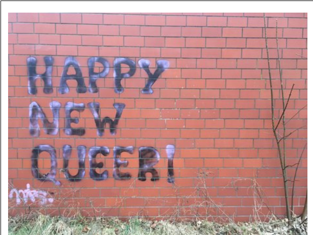
Gesehen in Hamburg.

Die Landesregierung in BaWü musste die projek-