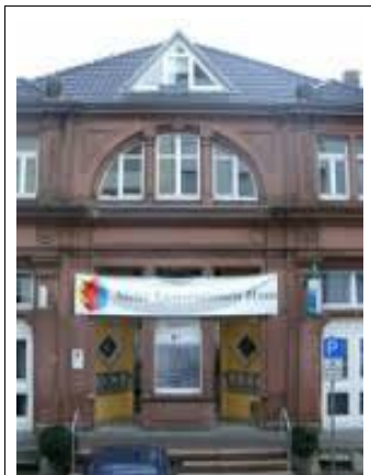
In diesem Gebäude in Mannheim ist unsere kleine Geschäftsstelle zu finden.

31.12.2008: 110 Mitglieder 31.12.2010: 120 Mitglieder 31.12.2012: 147 Mitglieder 31.12.2013: 148 Mitglieder 31.12.2014: 144 Mitglieder 31.12.2015: 163 Mitglieder 01.10.2016: 183 Mitglieder (davon haben vier zum Jahresende ihren Austritt erklärt)