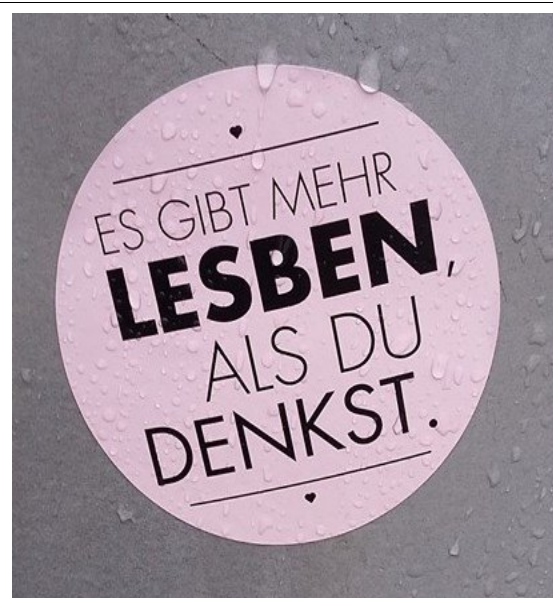
Gilt bestimmt auch für S und B und T und I und Q.

GLAAD ist eine Non-Profit-Organisation in den USA, die den Medien nicht nur Informationen zum LGBT-Themenkomplex bereitstellen, sondern auch Weiterbildungen für Redakteure, Regisseure u. a. anbieten und einen Medien-Preis für faire, zutreffende und integrative Darstellungen der LGBT-Themen verleihen.