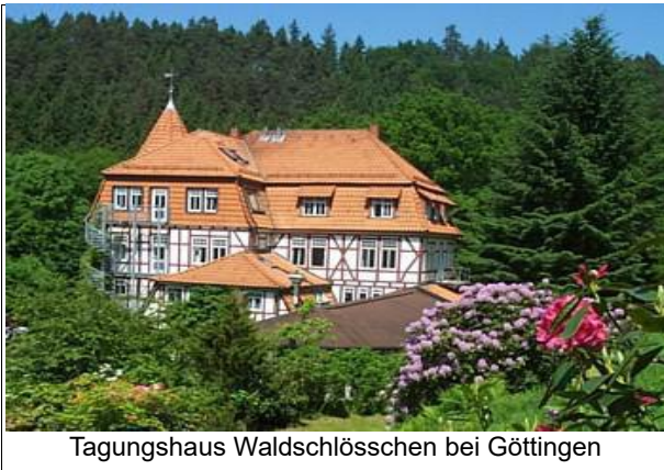
Tagungshaus Waldschlösschen bei Göttingen

(js) Der Termin für unser nächstes Jahrestreffen vom 7.-9. April 2017 im Waldschlösschen bei Göttingen ist schon lange kommuniziert und hoffentlich mit dickem Stift in eurem Kalender notiert. Das Programm ist allerdings noch nicht gänzlich eingetütet. Mit einigen potentiellen Referent*innen sind wir noch im Gespräch, ohne dass wir schon einen unterschriebenen Vertrag vermelden können. Wahrscheinlich wird es zum Themenbereich Rassismus ein Angebot geben.