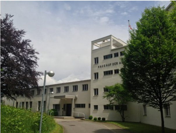
„Haus auf der Alb“ in Bad Urach

(em) In den abgegebenen Evaluationsbögen (N=26) äußerten sich die Teilnehmenden bei einer durchschnittlichen Bewertung mit der Schulnote „2“ 1 (arithmetisches Mittel: 1,6) insgesamt eine gute Zufriedenheit mit dem Fachtreffen.