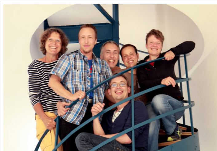
Der Vorstand, fotografiert im Uracher Tagungshaus Mai 2016