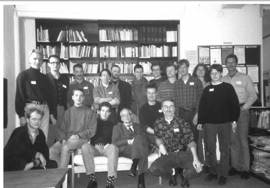
Der große Moment der Verbandsgründung. Hier sind die Held_innen der ersten Tage.

eigentliche Verbandsvater. Leider verstarb er viel zu früh und völlig überraschend schon 2008. Damals hat der VLSP sogar eine Todesanzeige zu seinem Gedenken in der Süddeutschen Zeitung aufgegeben.