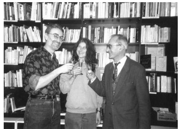
Der erste Vorstand des VLSP

was die Verbandsgründung für sie persönlich bedeutet hat. Vielleicht findet sich aber noch jemand im Verband, der / die bei der Gründung dabei war und über die damalige Zeit berichten möchte. Wir würden's gerne abdrucken.