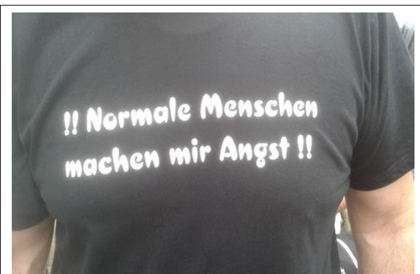
T-Shirt. Gesehen auf einem CSD

Also wo soll der VLSP hin? Vier Mitglieder schreiben was ihnen der VLSP bedeutet und in welcher Richtung sie den Verband gerne sehen möchten.