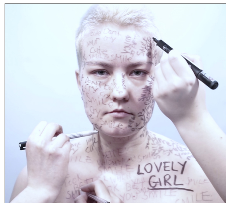
Abb. 4: Kai D. Janik, Persona , 2018, Videoinstallation, Video Still