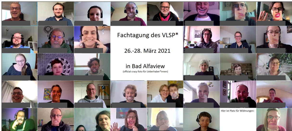
Snapshot von der online-MV mit allen, die aufs Foto wollten.