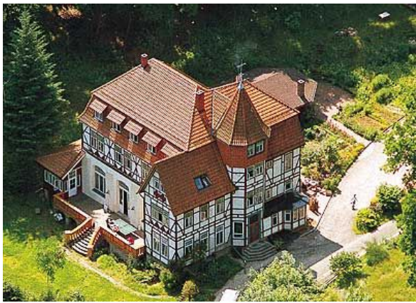
Das Waldschlösschen. Das ganze Haus war für uns gebucht. Jetzt wird es leer bleiben.

schlösschen – immerhin seit vielen Jahren unserem Stammhaus – angeboten, einen Spendenaufruf im Newsletter abzudrucken. Hier ist er: