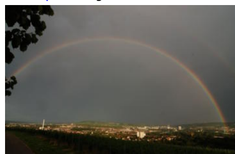
Regenbogen über Stuttgart