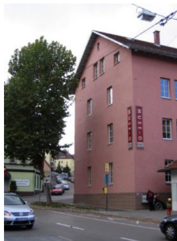
Unser Tagungsort Muse-O

Leider kommt das geplante Symposium an der Berliner Charité nicht zustande, aber wir haben eine hervorragende Alternative gefunden. Die Stuttgarter Regionalgruppe ist kurzfristig eingesprungen und kümmert sich um Raum und Logistik und was sonst noch ansteht, um dem Treffen einen guten Rahmen zu geben. Alle die 2007 dabei waren, werden sich erinnern, wie angenehm es im Muse-O war.